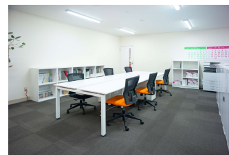
専用ワークスペース